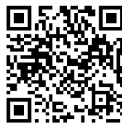
Impressionen vom Denkmalkurs 2024

Zum Abschluss dieses Wochenendes haben wir einen archäologischen Vertrauensmann der Denkmalbehörde Schleswig-Holstein eingeladen, der uns spannende Details aus praktischen Bodendenkmalpflege mitbringt.